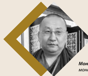
Монах Алтан монастырь Таши Чойлинг (Монголия)