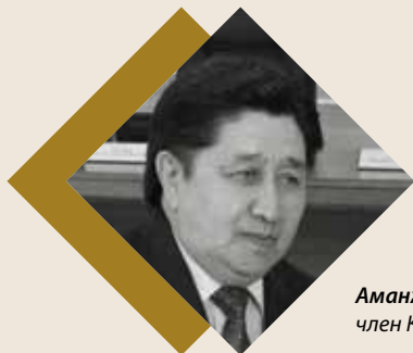
Аманжол Нурмагамбетов член Конституционного Совета РК