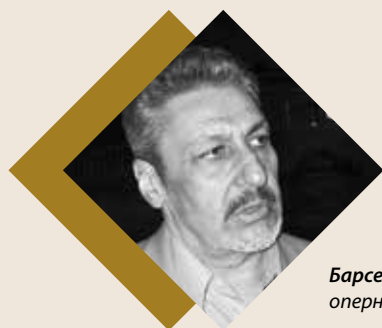
Барсег Туманян оперный певец, народный артист РА

Вообще отмечу, что мы должны быть законопослушными гражданами Казахстана, т.к. здесь мы представляем Армению; мы также должны быть законопослушными гражданами Армении, и это - очень правильный подход.