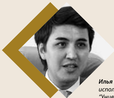
Илья Уразаков исполнительный директор "Универсиады-2017"