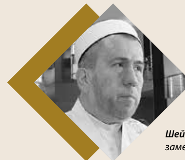
Шейх Мухаммад Хусейн Алсабеков заместитель Верховного муфтия Казахстана

Я как человек, занимающийся много лет межрелигиозной проблематикой, знаю, как осторожно ООН всегда относилась к религии. Мы в свое время предлагали, это было достаточно давно, создать при ООН постоянно действующий орган из религиозных лидеров. Эта позиция не была принята. Организация подчеркивала, что она светская, она не имеет отношения к религии. А вот сегодня стало ясно, что без религии невозможно налаживать мир, что без религиозных лидеров невозможно урегулирование даже политических конфликтов. И это действительно прорыв. Но то, что Казахстану удалось пригласить Генерального секретаря ООН и это станет, я надеюсь, повесткой дня ООН, это действительно важнейшее достижение этого съезда.