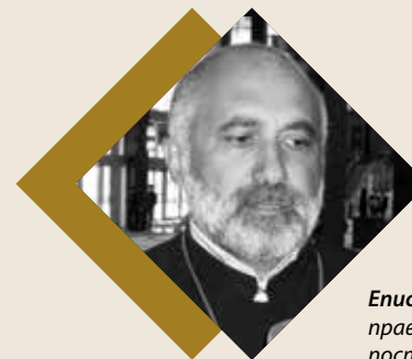
Епископ Маркос Ованнисян правлящий архиерей Украинской Епархии ААЦ, постоянный член Секретариата Съезда лидеров мировых и традиционных религий

- Эта программа как раз основывается на той базе, на которой сформирован менталитет нашего народа. В программе “100 шагов”, которая определяет план развития нашей страны, представляется новый этап развития Казахстана, совершенно новые подходы. Среди них - 6 шагов, которые непосредственно относятся к единому будущему наших граждан, и в этом наше многонациональное, многоконфессиональное разнообразие должно сыграть ведущую роль для реализации других шагов, потому что без мира и согласия невозможно экономическое и другое развитие. На фоне угроз глобального характера, вызовов религиозного экстремизма, конфессионально-этнической розни, тех событий, которые происходят вокруг нас, нам нужно сплотиться. Только сплоченное внутри государство, объединенное единой целью и идеологией, имеет свое будущее.