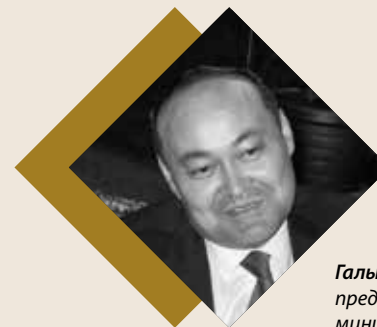
Галым Шойкин председатель комитета по делам религий министерства культуры и спорта Казахстана